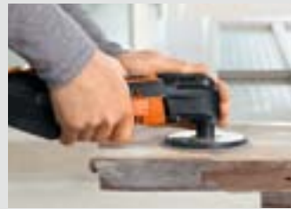
Fenster und Tore