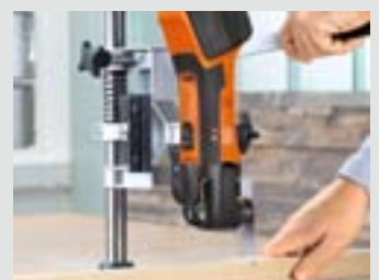
Werkstatt und Modellbau