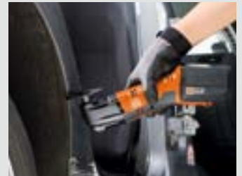
Rund ums Auto